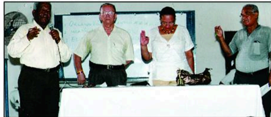
EL PRESIDENTE DE AMAJUBOL TOMANDOLE EL JURAMENTO A LA MESA DIRECTIVA DE LA ASAMBLEA GENERAL