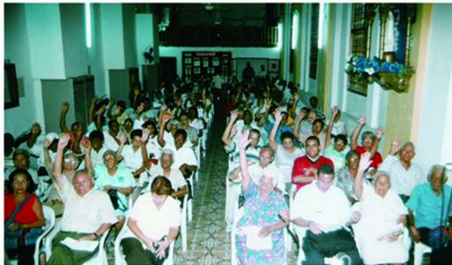
En la Asamblea General Ordinaria del 1 de diciembre se tomaron decisiones de trascendental importancia. En la foto parcial, en un momento de votación. Así mismo, en dicho evento se eligieron los siete delegados y los tres posibles confederales que le corresponden a Amajubol en el Congreso Nacional de la C.P.C. que se realizará en Ibagué, Tolima, a principios del año entrante.