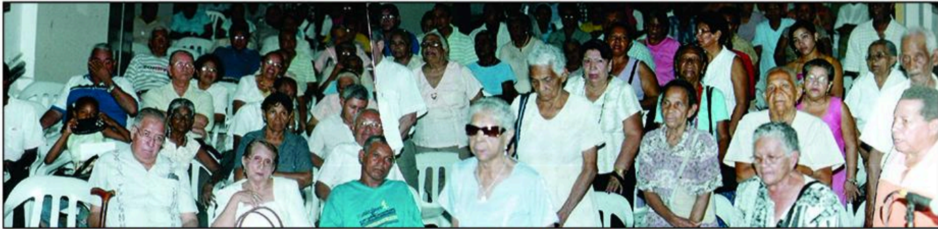
CON UNA CONCURRIDA ASISTENCIA SE LLEVO A CABO LA ASAMBLEA GENERAL ORDINARIA PARA DAR Y RECIBIR INFORMES DE LA GESTION EN AMAJUBOL