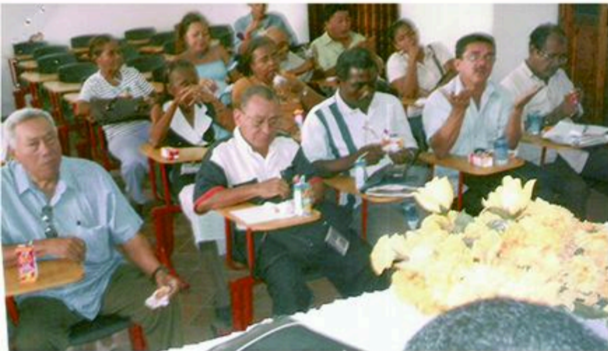
Panorámica de los asistentes a la rueda de prensa convocada por Amajubol, donde el presidente de la Asociación contó la historia del proceso 0167 resaltando los hechos verdaderos que la corrupción quiere ocultar con otras ruedas de prensa. Los socios y la opinión pública no deben dejarse desorientar porque tarde o temprano, la verdad verdadera tendrá que brillar.