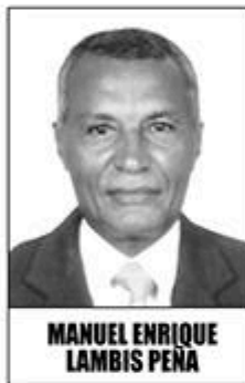
MANUEL ENRIQUE LAMBIS PEÑA

Me complace dirigirme a los jubilados de mi departamento y en general a todos los jubilados de Colombia, y a la ciudadanía en general, a través del Boletín del Jubilado, por cuanto ha sido una de mis preocupaciones el atender a este gremio en el pago, no solamente de sus mesadas pensionales, sino en todo lo que tiene que ver en el pago de sus prestaciones sociales, en la vinculación de