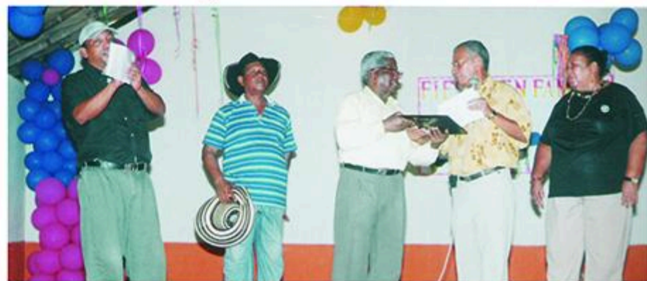
La Secretaria de Recreación y Deporte y su comité hace entrega de una placa de reconocimiento a su labor, al presidente de Amajubol.