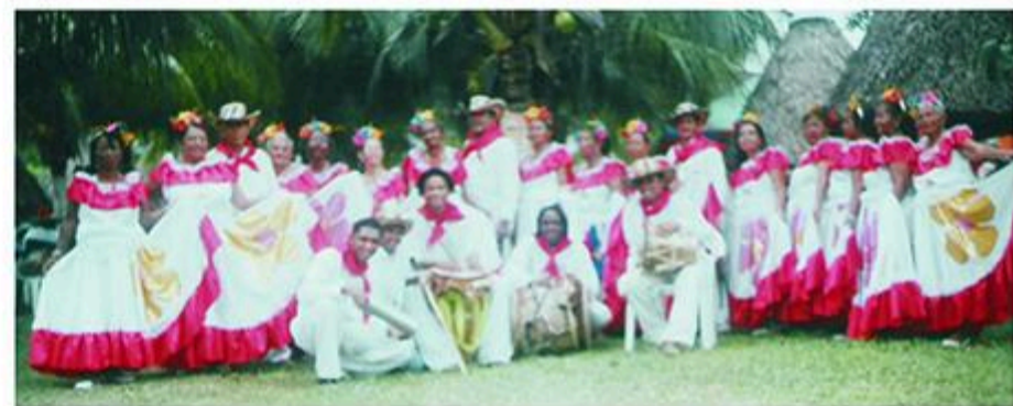
EL GRUPO "AÑOS ALEGRES": ORGULLO DE AMAJUBOL

La Fiesta del Día del Pensionado y la Tercera edad que se celebró en Mompox asistieron 60 afiliados y tuvo un costo de $3.700.000; en Magangué asistieron 75 afiliados y tuvo un costo de $3.500.000; en Cartagena asistieron 570 afiliados y tuvo un costo de $15.685.800.