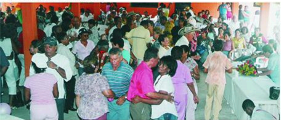
Este grupo de pensionados, como en sus primeros tiempos, bailando y celebrando su día.