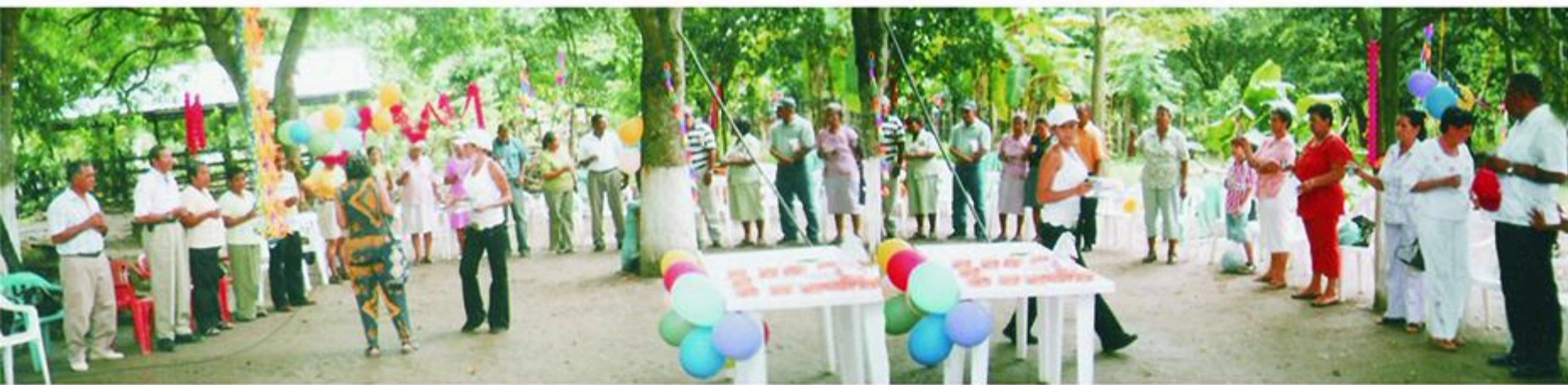
LA CELEBRACION EN MOMPOX ESTUVO CONCURRIDA Y MUY ENTUSIASTA, LOS AFILIADOS DEPARTIERON DICHOSOS EN SU DIA