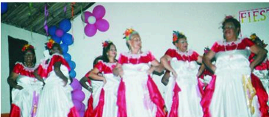
Se Sobró con su presentación el grupo folclórico "Años Alegres", el Día del Pensionado y la Tercera Edad. Felicitaciones para todas ellas.